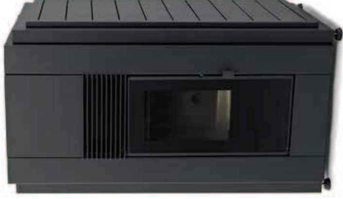
DOURO 23kW (PORTA DE VIDRO)