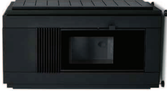
DOURO 17kW (PORTA DE VIDRO)